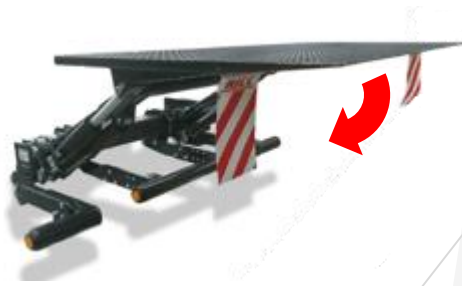
Knapp 2 + 3. Håll in knapp 2 och tryck samtidigt på knapp 3 för att vippa ner plattformen.