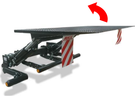
Knapp 2 + 1. Håll in knapp 2 och tryck samtidigt på knapp 1 för att vippa upp plattformen.