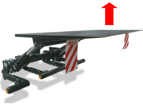
Knapp 1. Lyft funktion.