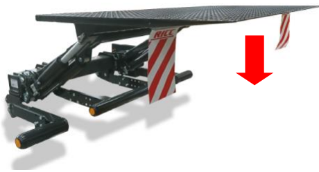
Knapp 3. Sänk funktion.